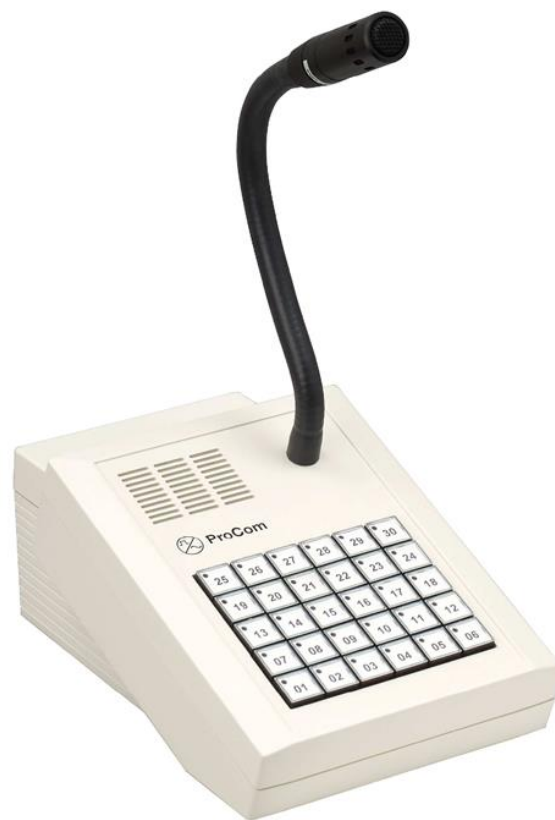
Abb. DTA-030 (L- Nr. 1.030)