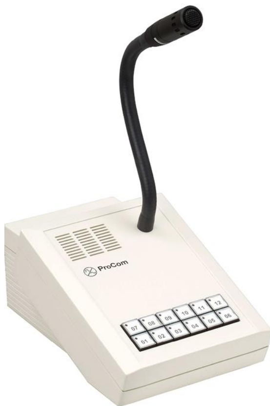
Abb. DTA-012 (L- Nr. 1.012)